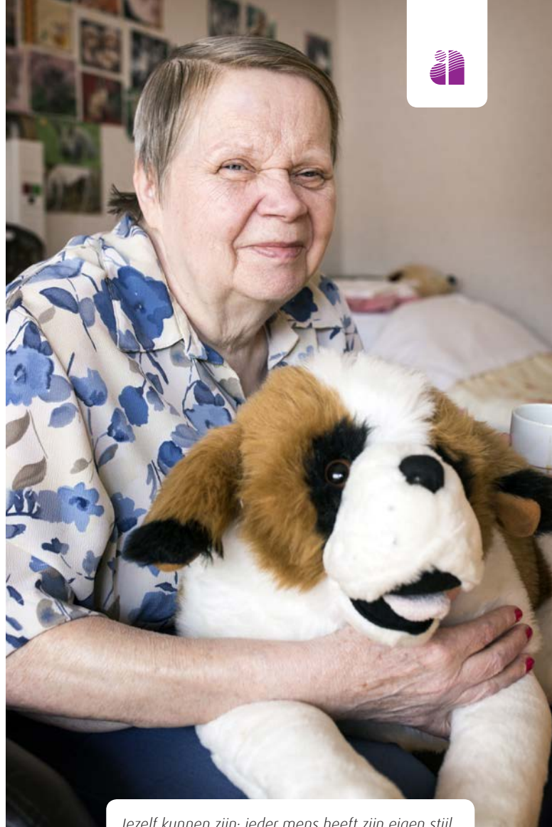
Jezelf kunnen zijn: ieder mens heeft zijn eigen stijl.

Tijdelijke zorg kan planbaar en niet-planbaar zijn. Niet-planbare tijdelijke zorg wordt door de huisarts ingezet en heet daarom ook wel eerstelijnszorg. In veel gevallen gaat het hierbij om zogenaamde herstelplekken, waarbij terugkeer naar huis binnen zes weken wordt verwacht. Tijdelijke zorg wordt uit de Zorgverzekeringswet gefinancierd. Bij Amstelring Zorgbemiddeling zijn altijd twee van de acht zorgexperts bezig voor het Aanmeldportaal Tijdelijke Zorg. Ook buiten kantooruren is de telefoon van het aanmeldportaal bemand.