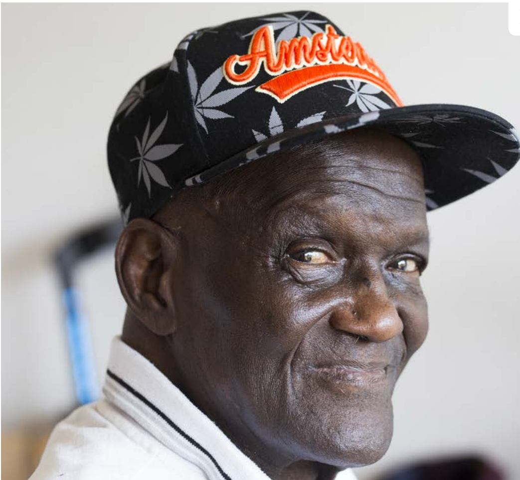
Bewoner van woonzorgcentrum De Venser, Amsterdam-Zuidoost.