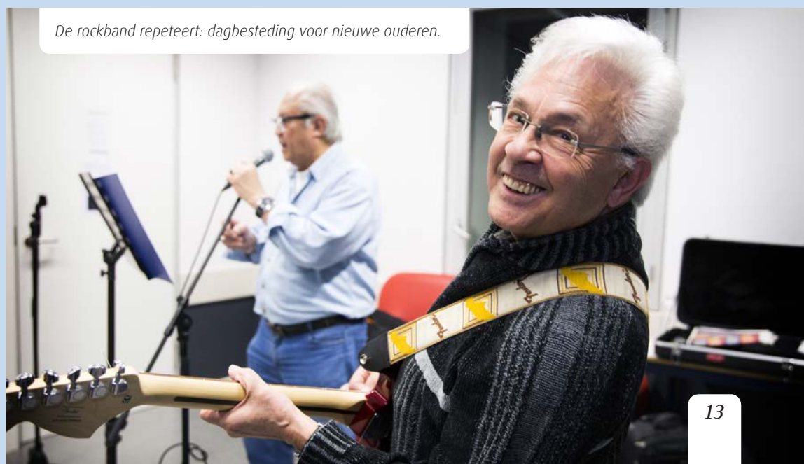
De rockband repeteert: dagbesteding voor nieuwe ouderen.

Amstelring is onderdeel van de samenleving en als maatschappelijke organisatie draagt Amstelring bij aan een meerwaarde voor de samenleving door het bieden van waardevolle zorg voor cliënten door betrokken medewerkers tegen een betaalbare prijs. Dit doet Amstelring in samenwerking met onder andere gemeenten, financiers, cliënten- en vrijwilligersgroepen en andere aanbieders van welzijn en zorg.