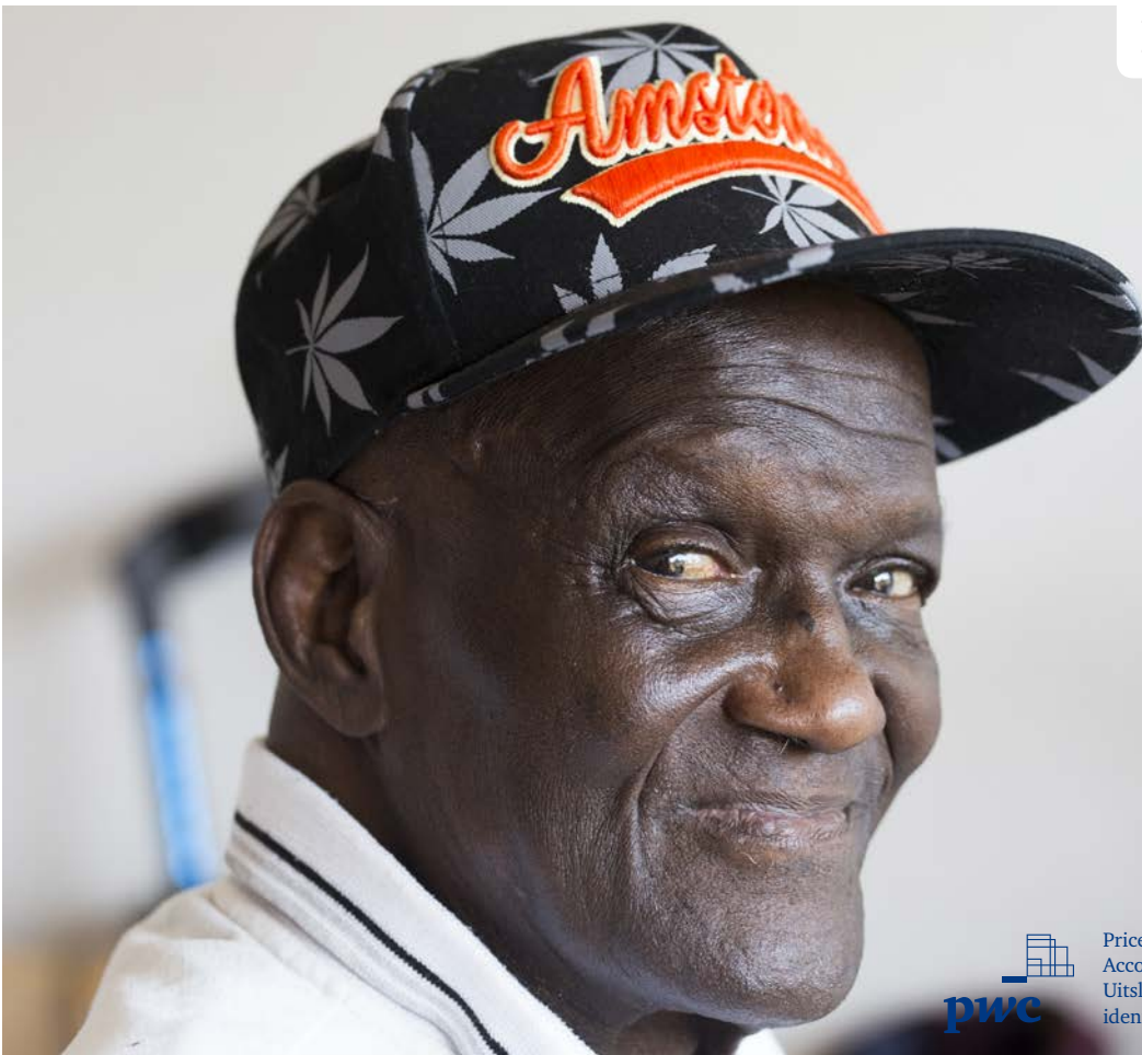
Bewoner van woonzorgcentrum De Venser, Amsterdam-Zuidoost.