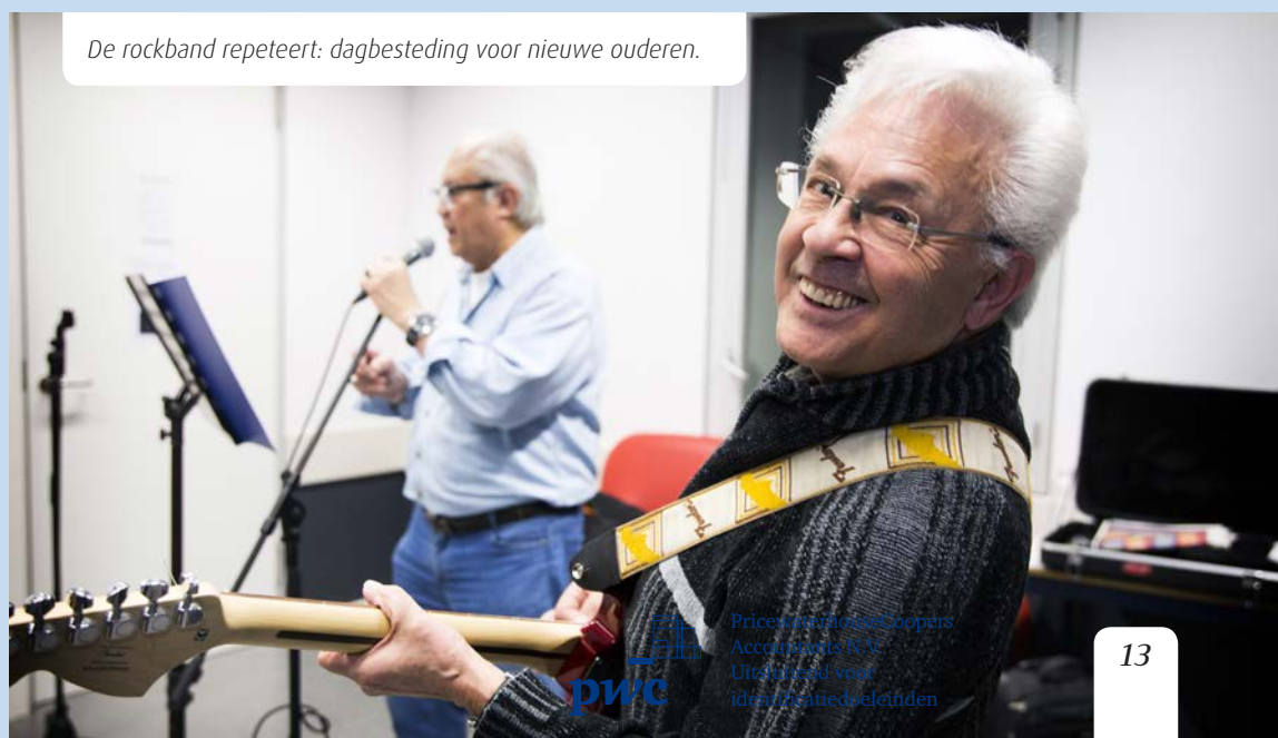
De rockband repeteert: dagbesteding voor nieuwe ouderen.

Amstelring is onderdeel van de samenleving en als maatschappelijke organisatie draagt Amstelring bij aan een meerwaarde voor de samenleving door het bieden van waardevolle zorg voor cliënten door betrokken medewerkers tegen een betaalbare prijs. Dit doet Amstelring in samenwerking met onder andere gemeenten, financiers, cliënten- en vrijwilligersgroepen en andere aanbieders van welzijn en zorg.